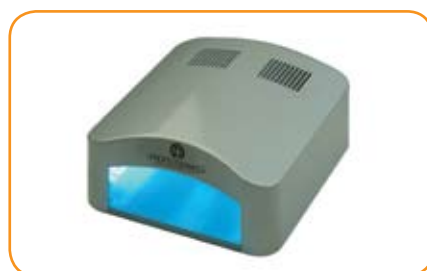
Lampe UV De Luxe 4 Tubes