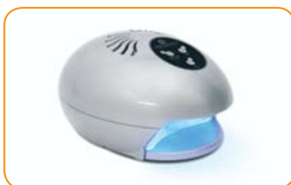
Lampe UV UFO 2 Tubes