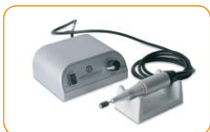
Extra Light Ventilée