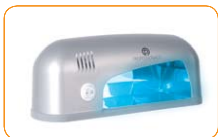
Lampe UV 1 Tube

DEMANDEZ CONSEIL AUPRÈS DE VOTRE FORMATRICE OU DE VOTRE REPRESENTANT RÉGIONAL!